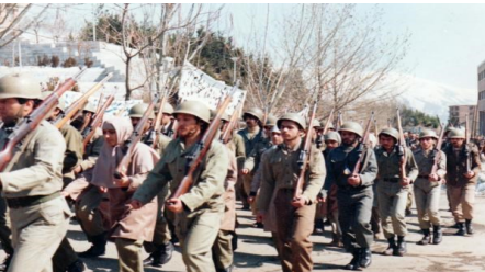
دانشگاه شهید بهشتی در زمان دفاع مقدس، دهه ۱۳۶۰