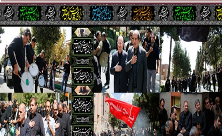
مراسم عزاداری امام حسین (ع) در دانشگاه شهید بهشتی